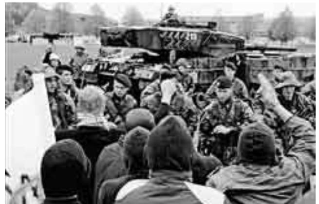
Einsatz von Kampfpanzer Leo II anlässlich der Übung Zeus der Inf Br 2 im Mai 06.

Die Schlagzeile unserer Boulevardzeitung zur Übung Zeus lautete dementsprechend unreflektiert: « Beim Zeus! Armee jagt Terroristen durch die Westschweiz » (Blick 9.5.2006). Das Schlagwort Terrorismus ist denkbar ungeeignet, um den Fächer an möglichen Bedro-