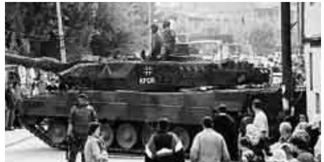
Kampfpanzer Leopard der Bundeswehr im Kosovo.

Bericht des Verbands österreichischer Blauhelme anlässlich der Balkanreise im Jahr 2004.