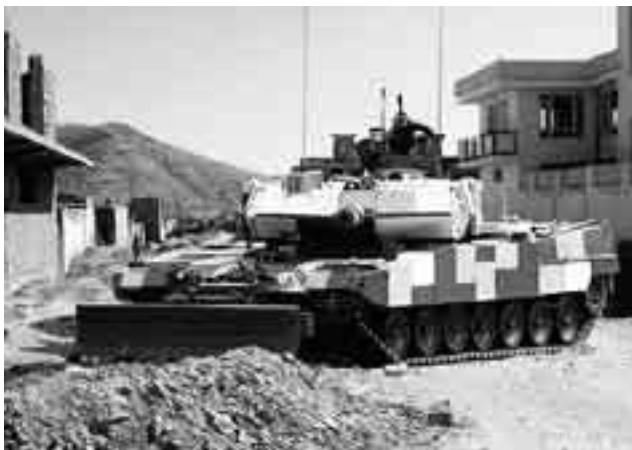
Leopard 2 PSO

Bei Marktreife muss auch die Anschaffung eines aktiven Schutzsystems geprüft werden, und zwar für alle mittelschwer- und schwerkgepanzerten Fahrzeuge. Des Weiteren müssen genügend Kampfpanzer modularartig den Anforderungen von friedensfördernden Einsätzen angepasst werden. Vorbild dabei ist die Weiterentwicklung Leopard 2 PSO (Peace Support Operation): Zusätzliche Schutzelemente an Turm und Fahrgestell, ein Räumschild, zusätzliche Bordwaffen, Beobachtungsmittel und Kamerasystem zur Rundumüberwachung, Schutz der Optiken und ein Aussenanschluss für die Bordverständigungsanlage, zur direkten Kommunikation mit den abgesehenen Einheiten. 6