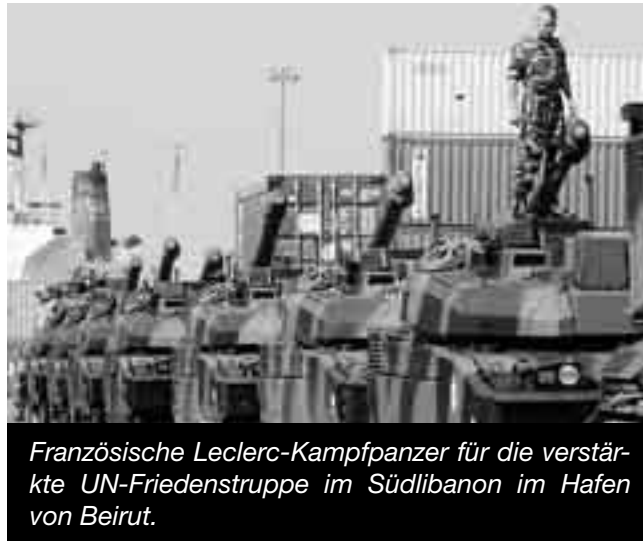
Französische Leclerc-Kampfpanzer für die verstärkte UN-Friedenstruppe im Südlibanon im Hafen von Beirut.

Aber auch die deutsche Bundeswehr, die politisch bedingt eine eher passive Rolle im verhältnismässig ruhigen nördlichen Teil Afghanistans wahrzunehmen