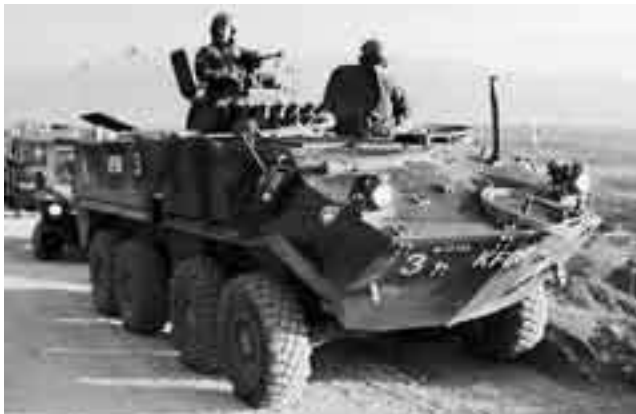
Bestgeschütztes und kampfkraftigstes Einsatzmittel der Swisscoy im Kosovo: Der Piranha.

wurden dazu Radschützenpanzer Piranha entsandt. Zumindest der Sicherungszug (seit kurzem zwei Züge, resp. aufgrund der Verlagerung der Einsatzaufgaben in Richtung Sicherung eine Infanteriekompanie) kann sich seither splittergeschützt verschieben und auch Konvois als Schutzelement begleiten.