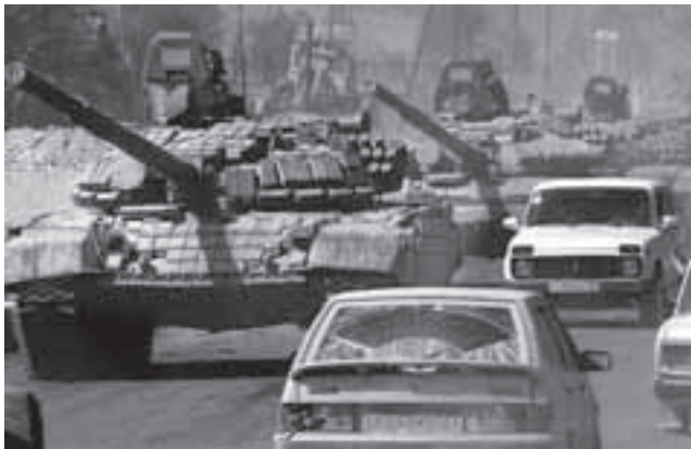
... Russische Aussenpolitik: T-80-Kampfpanzer in Südossetien ...

Es muss geklärt werden, welche spezifischen sicherheitspolitischen Interessen die Schweiz künftig verfolgen will und kann. Themen wie Energiesicherheit, Bedrohung durch Terrorismus oder physische Integrität der Schweizer Bürger im In- und Ausland sind in den letzten Jahren zunehmend ins Zentrum der Sicherheitsinteressen unserer Gesellschaft gerückt, während die Verteidigung der territorialen Souveränität aufgrund der niedrigen Eintretenswahrscheinlichkeit momentan als weniger dringlich wahrgenommen wird. Die Verlagerung eines Teils unserer Sicherheitsbedürfnisse über die Landesgrenzen hinaus verlangt auch eine Definition des geografischen Interessensraums der Schweiz. Das bedeutet, dass für die sicherheitspolitischen Instrumente politisch akzeptierte und mehrheitsfähige Aktionsradien definiert werden müssen, in denen sie zum Einsatz gelangen können.