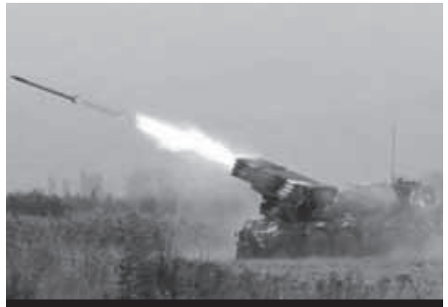
Georgische Lösung für innenpolitische Probleme: Mehrfachraketenwerfer RM-70 gegen südossetische Separatisten ...

Die Ursachen für den aufbrechenden Dissens liegen eindeutig tiefer als im temporären parteipolitischen Taktieren: Den Parlamentariern fehlt sowohl die aus-