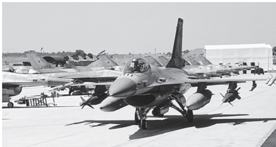
Eine kampfwertgesteigerte F-16, bewaffnet mit AMRAAM-Raketen und zwei laserlenkten Bomben auf dem süditalienischen Militärflugplatz Amendola.

Die systematische Unterdrückung der ethnisch albanischen Mehrheit im Kosovo durch die Zentralregierung in Belgrad veranlasste die Regierungen der NATO-Staaten, öffentlich eine militärische Intervention zu diskutieren. Nachdem die dip-