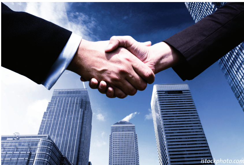
Die öffentlich-private Kooperation gewinnt auch in der Sicherheitspolitik an Gewicht.

Die Zusammenarbeit zwischen öffentlichen und privaten Akteuren ist zu einem wichtigen Instrument im Politikbereich der inneren Sicherheit geworden. Public-Private Partnerships (PPPs) übernehmen wesentliche Aufgaben beim Schutz kritischer Infrastrukturen, bei der Cyber-Sicherheit oder bei der Gewährleistung der Versorgungssicherheit. Die Schwierigkeiten bei der Umsetzung solcher Partnerschaften in den Bereichen Koordination, Erwartungsmanagement, Transparenz und Gewährleistung der Kohärenz dürfen aber nicht unterschätzt werden.