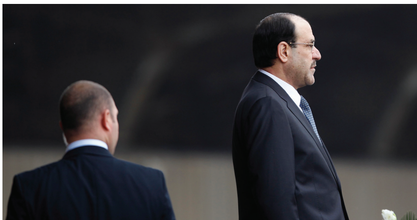
Der schiitische Ministerpräsident al-Maliki hat mit seinem autoritären Regierungsstil die Sunniten und die Kurden gegen sich aufgebracht. Bagdad, 6.1.2012

Die USA vermochten bei ihrem Abzug aus dem Irak Ende 2011 kaum zu kaschieren, dass ihre Irakpolitik gescheitert ist und sie ein instabiles Land hinterlassen. Die seit Monaten beobachtbare Akzentuierung konfessioneller und ethnischer Konfliktlinien im Irak ist aber auch als Versagen der Politik in Bagdad zu werten. Eine erneute Gewaltexplosion ist nicht mehr auszuschliessen, zumal das regionale Kräfteverhältnis zwischen Iran auf der einen Seite und den sunnitischen Golfmonarchien und der Türkei auf der anderen Seite zentrifugale Tendenzen im Irak fördert. Die Krisen in Syrien und im Irak verschränken sich dabei zunehmend.