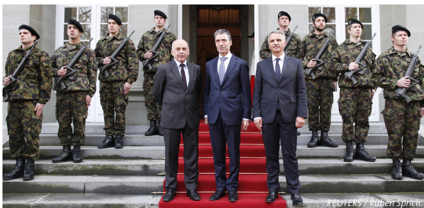
Les conseillers fédéraux Maurer et Burkhalter avec M. Rasmussen, Secrétaire général de l'OTAN, le 22 nov. 2012

L'amenuisement des budgets consacrés à la défense en Europe s'accompagne d'une pression croissante à la coopération en matière de politique d'armement et de défense. Le «Pooling and Sharing» et la «Smart Defence» de même qu'une série de nouvelles initiatives subrégionales visent à renforcer les capacités militaires nationales par le biais d'une coopération multinationale pragmatique. Les nouvelles possibilités de collaboration sont importantes pour la Suisse tant pour des raisons économiques que militaires.