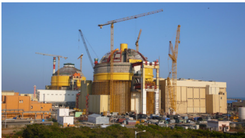
La question d'une adhésion de l'Inde au NSG est source de controverses: construction de réacteurs nucléaires à Kudankulam, Inde, le 14 avril 2009.

Le Groupe des pays fournisseurs nucléaires (NSG), dont fait aussi partie la Suisse, veut empêcher les exportations pouvant être détournées en vue de la fabrication d'armes nucléaires. L'identité du NSG est débattue au regard de la prolifération des programmes nucléaires pacifiques et des aspirations de l'Inde, Etat doté d'armes nucléaires, à une adhésion: est-il un groupe dont le but est de renforcer la norme de non-prolifération nucléaire ou un regroupement d'Etats capables d'exporter des biens nucléaires?