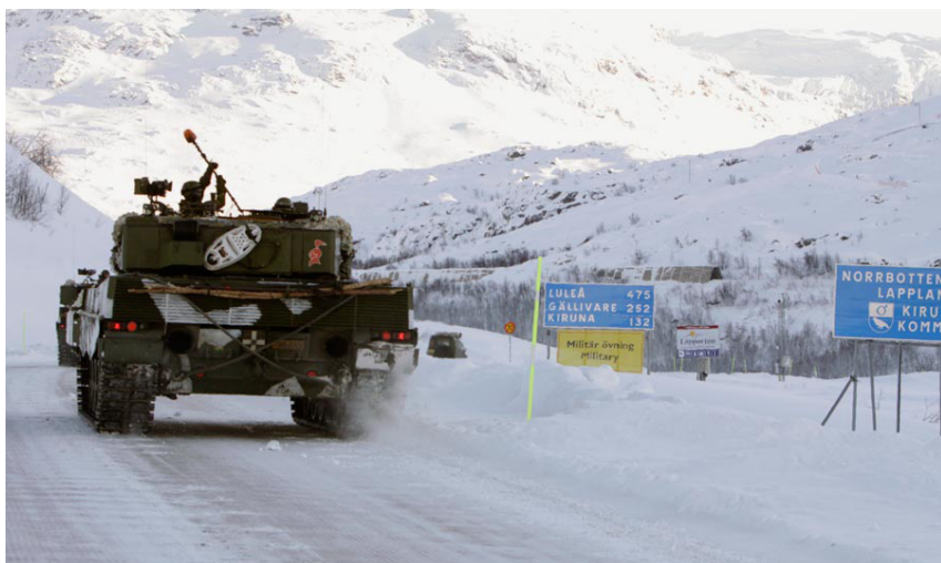
Au cours de l'exercice militaire de l'OTAN «Cold Response 2010», armures norvégiens traversent la frontière vers la Suède.

La politique de défense fait l'objet de vives discussions en Suède. Le commandant en chef suédois se plaint que son armée ne pourrait défendre le pays contre un agresseur que pendant une semaine. La crainte de la Russie ramène la défense territoriale sous les feux de l'actualité après que l'armée suédoise se soit beaucoup tournée vers les missions à l'étranger. Les critiques doutent que la Suède puisse encore se défendre dans le cas d'une guerre, ce qui donne lieu à des discussions sur la défense collective et le devoir d'assistance – bien que la Suède reste fidèle à son non-alignement militaire.