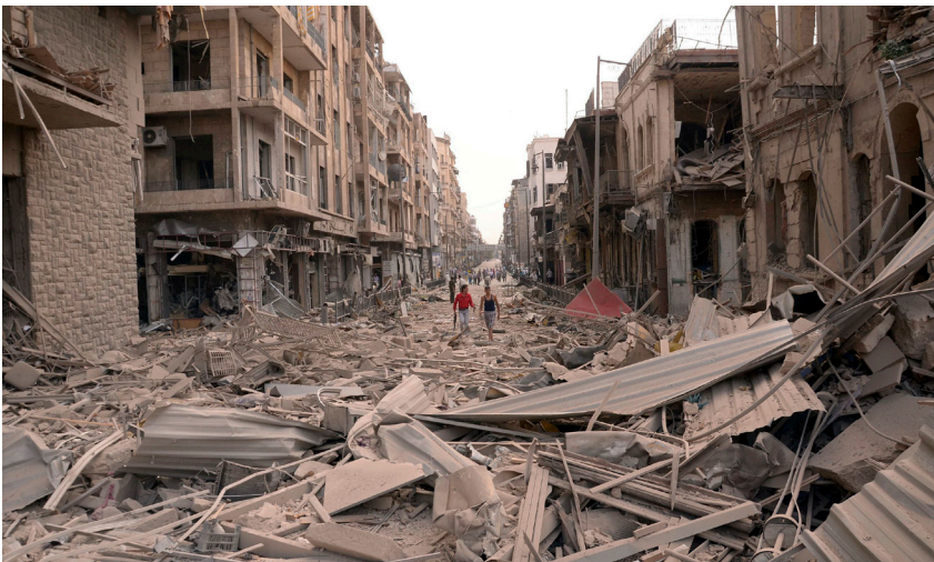
Kriegsversehrte Strasse in Aleppo, 3. Oktober 2012

Die Chancen auf eine vermittelte Regulierung des Bürgerkriegs in Syrien sind geringer denn je. Mit einer weiteren Eskalation der Gewalt ist zu rechnen, wobei nicht alle Szenarien einen lang andauernden Abnutzungskrieg erwarten lassen. Eine westliche Militärintervention zeichnet sich angesichts der Spaltung der UNO und der hohen Risiken eines solchen Einsatzes vorderhand nicht ab. Der Syrienkonflikt wird dabei immer mehr zu einem regionalen Stellvertreterkrieg, dessen Ausgang weitreichende Folgen für die Machtverhältnisse in Nahost haben wird.