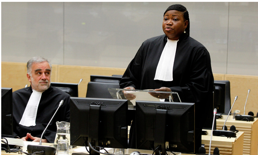
Stabsübergabe am ICC: Fatou Bensouda (Gambia) löste am 15. Juni 2012 Luis Moreno Ocampo (Argentinien) als Chefanklägerin ab.

Nach gut zehnjähriger Tätigkeit hat sich der Internationale Strafgerichtshof ( International Criminal Court , ICC) als feste Grösse in der internationalen Strafjustiz etabliert. Doch strukturelle, rechtliche und politische Herausforderungen bleiben bestehen: Die unvollständige Mitgliedschaft ist problematisch, die Fokussierung auf Afrika ruft Kritik hervor und das Verhältnis zwischen Gerechtigkeit und Frieden birgt Spannungen. Trotz dieser Schwierigkeiten entfaltet der ICC auch präventiv Wirkung.