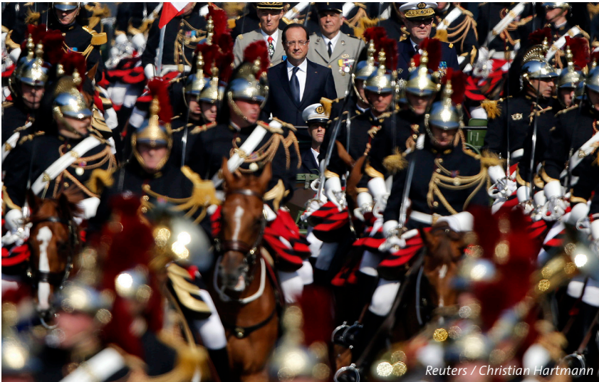
Der französische Präsident François Hollande bei der traditionellen Militärparade am 14. Juli 2013 in Paris.

Das französische Weissbuch zur nationalen Sicherheits- und Verteidigungspolitik ist mit Spannung erwartet worden. Denn zurzeit überdenkt die EU dieses Politikfeld neu. Angesichts schrumpfender Militärbudgets ist Frankreich, die wichtigste Militärmacht auf dem europäischen Festland, gezwungen, seine Ambitionen zurückzufahren. Gleichzeitig will Paris die gemeinsame europäische Sicherheits- und Verteidigungsanstrengungen forcieren.