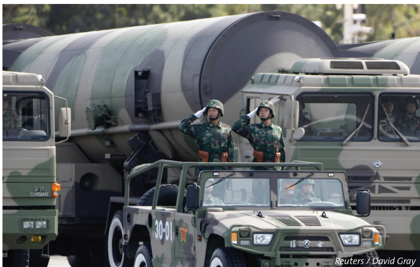
La Chine modernise ses lanceurs: missiles balistiques lors d'une parade militaire à Pékin, le 1 er octobre 2009.

La Chine développe lentement mais sûrement ses capacités nucléaires. Son objectif est de pouvoir maintenir à l'avenir aussi une capacité nucléaire de seconde frappe crédible contre les Etats-Unis. Mais, de surcroît, la Chine voit de plus en plus l'arme nucléaire comme une monnaie politique. L'Inde, puissance atomique voisine, perçoit surtout l'armement nucléaire de la Chine comme une menace. Il pourrait en résulter une déstabilisation nucléaire de la région asiatico-pacifique.