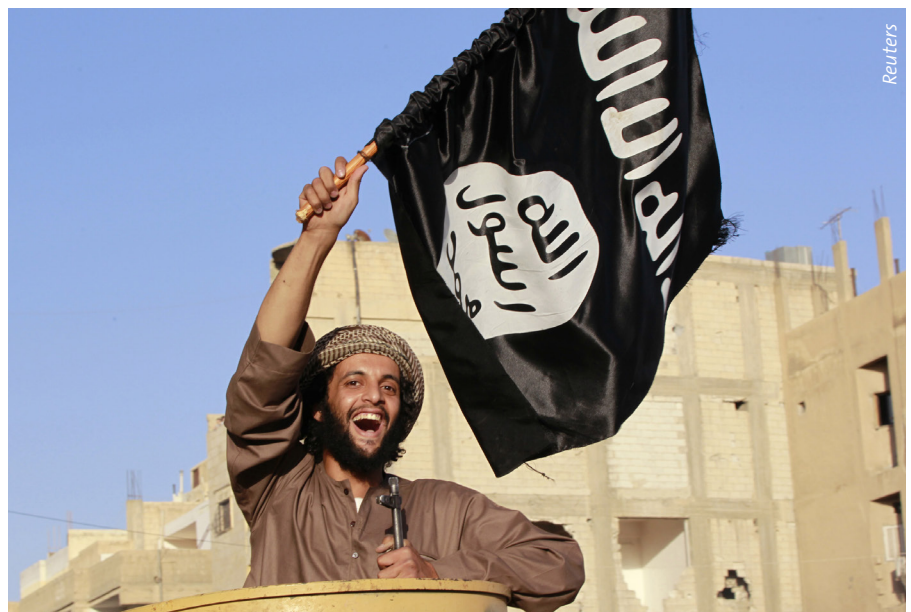
Ein Dschihad-Kämpfer feiert im Juni 2014 im syrischen Raqqa das Ausrufen eines islamischen Kalifats.

Der IS zeichnete sich 2014 durch die Verbindung von beeindruckenden militärischen Erfolgen und professioneller Propagandamaschinerie aus. Im Gegensatz dazu zeigt sich die Kern-Kaida nach jahrelanger Verfolgung in Afghanistan und Pakistan nachhaltig geschwächt. Eine junge Generation von Dschihadisten propagiert eine deutlich konfessionellere Agenda, die sich nahtlos in das politische Klima einiger noch immer unter den Auswirkungen der Revolten von 2011 leidender arabischer Länder einfügt. Die Kaida sieht sich nun in Syrien und Irak sowie in Libyen und möglicherweise bald auch in Algerien dem IS ausgesetzt. Auch in Nigeria und Ägypten haben dschihadistische Splittergruppen dem IS Gefolgschaft gelobt.