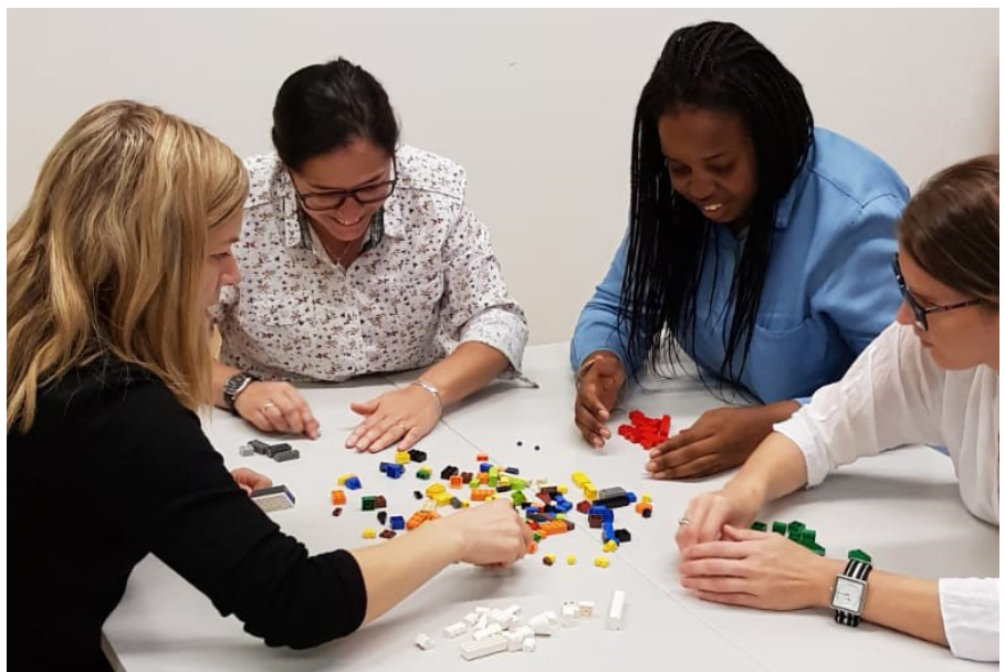
Simulationsübung in der Klasse im MAS ETH Mediation in Friedensprozessen.

Mediation ist ein nicht militärischer Ansatz zur Konfliktlösung, bei dem die Konfliktparteien die Hilfe einer dritten Partei annehmen, um eine für beide Seiten akzeptable Vereinbarung auszuhandeln. Gemäss den Vereinten Nationen sind die Bedingungen für eine wirksame Mediation