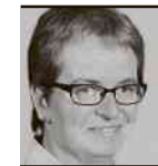
von Claudia Meier

Der Besuch einer Sauna dient der Körperreinigung, stärkt das Immunsystem und verbessert das Wohlbefinden. Anders als in Skandinavien, wo fast jedes Haus über einen eigenen Saunabereich verfügt, muss man für den Saunagang in der Schweiz in der Regel einen längeren Weg und somit etwas mehr Zeit einplanen. Es ist wie bei den Ferien: Bereits mit der Vorbereitung steigt die Vorfreude auf das - hoffentlich - schöne Erlebnis. Wenn der Service stimmt, gönnt man sich diese Ausgabe gerne.