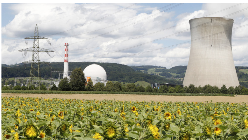
Centrale nucléaire de Leibstadt, le 9 juillet 2012

La décision de sortir du nucléaire revêt une portée stratégique pour la Suisse. La mise en place d'un approvisionnement sûr, économique et compatible avec le climat sans l'atome représente un grand défi politique et social. Différents développements dans le contexte européen compliquent la restructuration de l'approvisionnement énergétique. Une mise en œuvre réussie de la «stratégie énergétique 2050» du Conseil fédéral suppose un consensus quant à la répartition des charges.