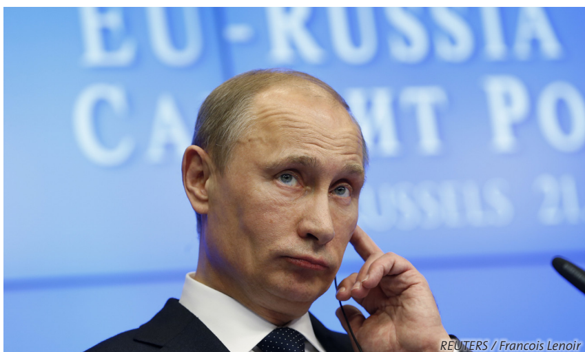
Des relations tendues: Vladimir Poutine au sommet UE-Russie à Bruxelles, le 21 décembre 2012.

Alors que l'importance économique de la Russie a augmenté en Europe ces dernières années, ses relations politiques se sont détériorées. La Russie a de nouveau, sous Poutine, des ambitions redoublées de grande puissance et défend de plus en plus des intérêts et des valeurs différents de ceux de l'Occident. Les espoirs d'une identité post-impériale et démocratique de la Russie se sont fortement estompés. L'Europe et les Etats-Unis doivent essayer de préserver leurs intérêts par une combinaison de coopération et de concurrence stratégique.